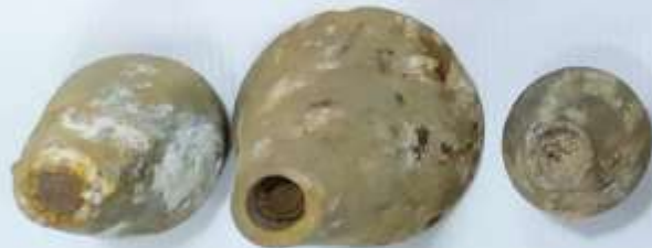
Взрыватели миномётных мин