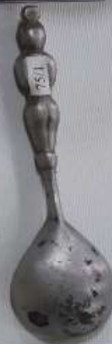
Алюминиевая самодельная ложка красноармейца