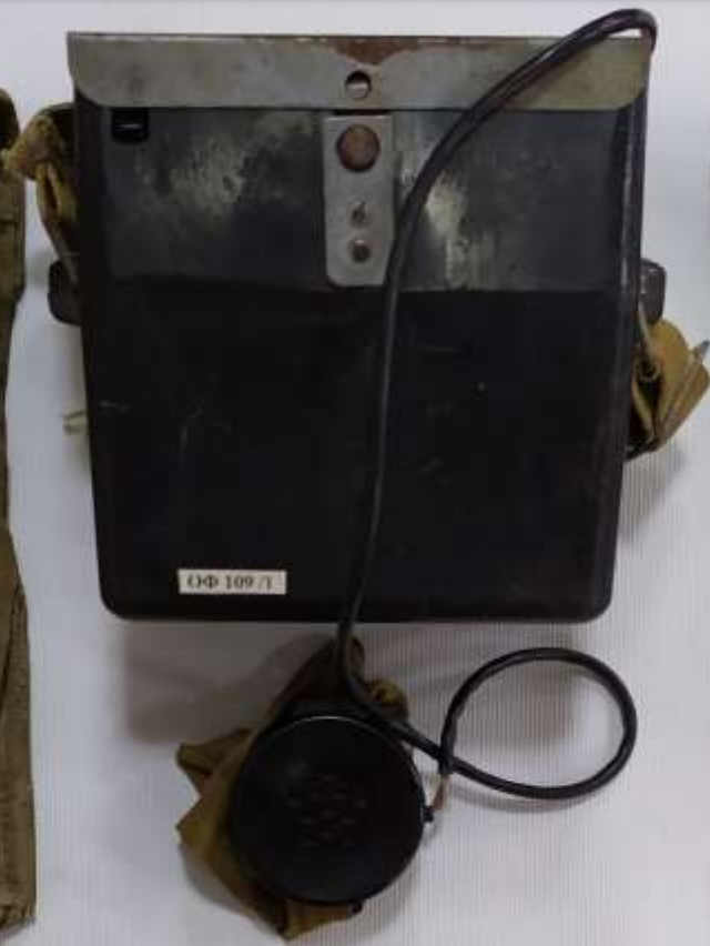
Полевой телефон аппарат