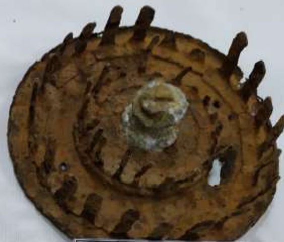
Дисковый магазин ручного пулемёта ДТ (Дегтярёв танковый)