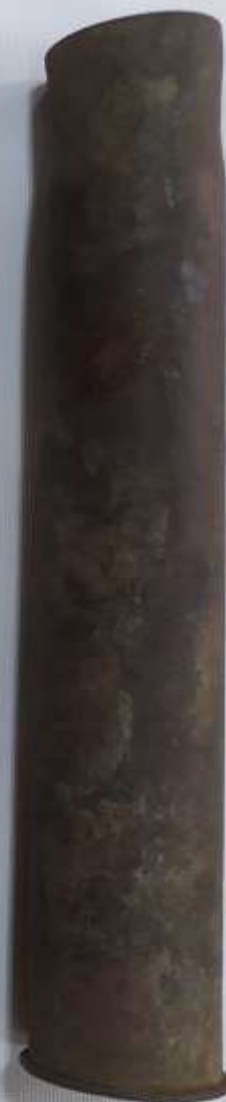
Гильза артиллерийского противотанкового снаряда, калибр 45мм.