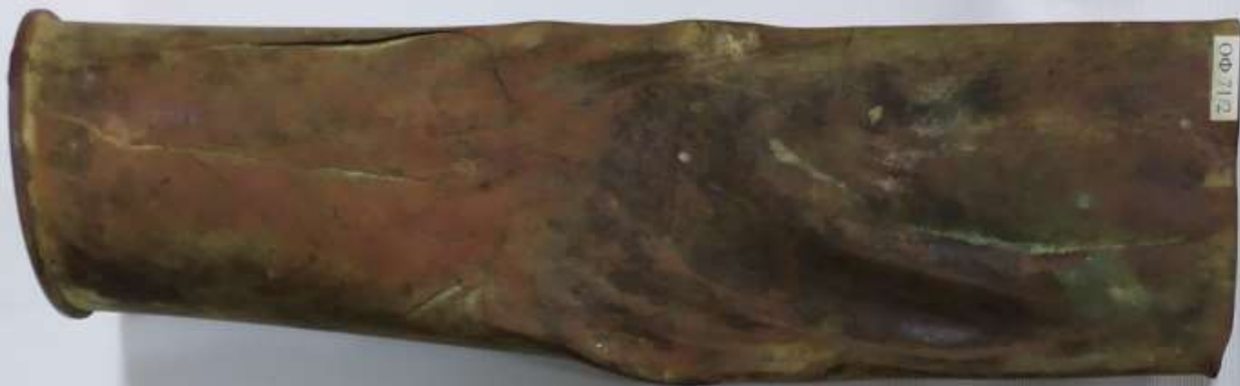
Гильза артиллерийского снаряда, калибр 85мм.