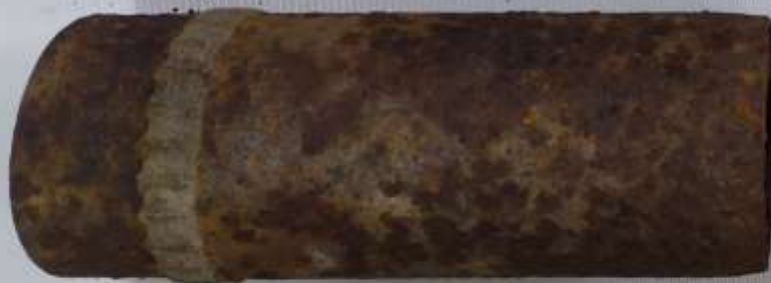
Боеприпас артиллерийский калибр 76.2мм. шрапнельный снаряд