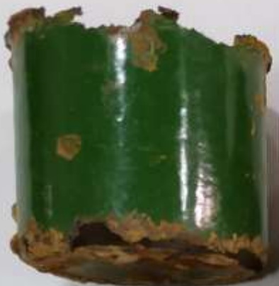
Солдатская кружка с места боя