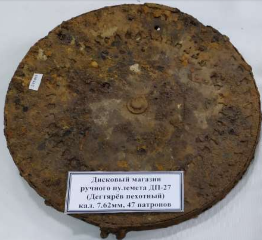
Дисковый магазин ручного пулемета ДП-27 (Дегтярёв пехотный) кал. 7.62мм, 47 патронов