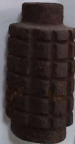
Противопехотный оградительный миный заряд ПОМЗ