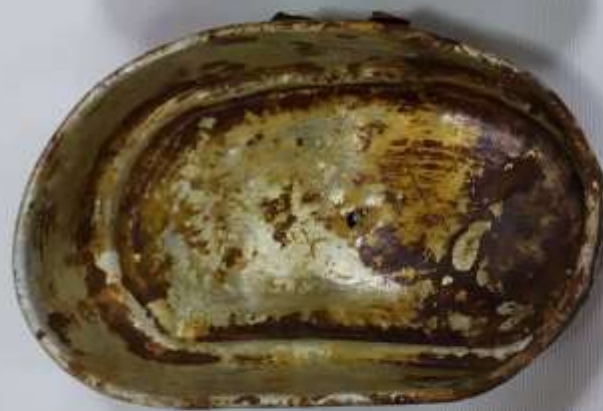
Солдатский котелок с крышкой