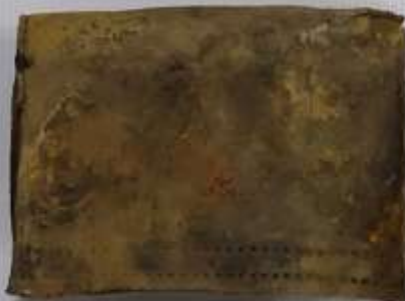
Кошелёк погибшего солдата