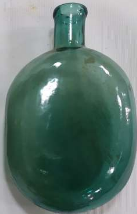
Фляжка солдатская стеклянная