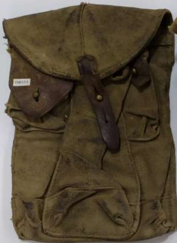
Солдатская сумка для патронов и гранат