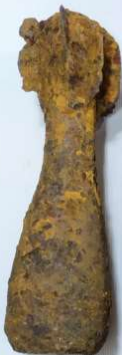
Миномётные мины (РККА)