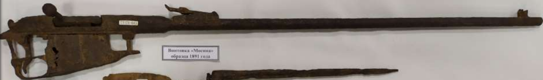
Винтовка «Мосин» образца 1891 года