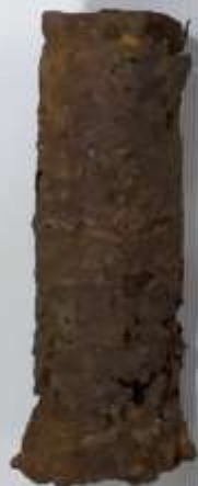
Ручка от противотанковой гранаты