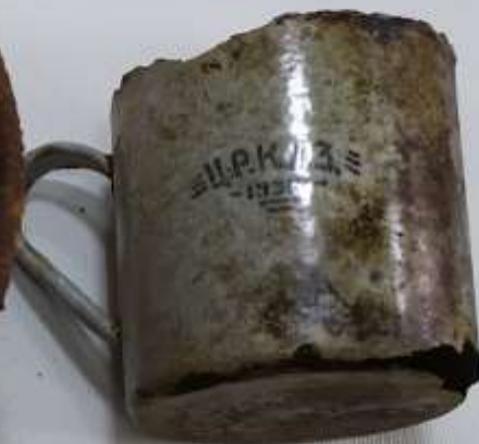
Солдатская кружка с места боя