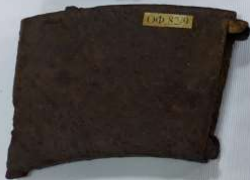
Обойма СВТ (снайперской винтовки Токарева)