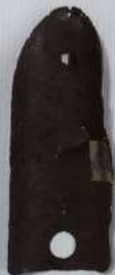
Скоба противотанковой гранаты РПГ-40