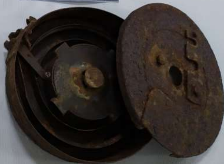
Барабанный магазин ППШ (пистолета пулемёта Шпагина) 71 патрон