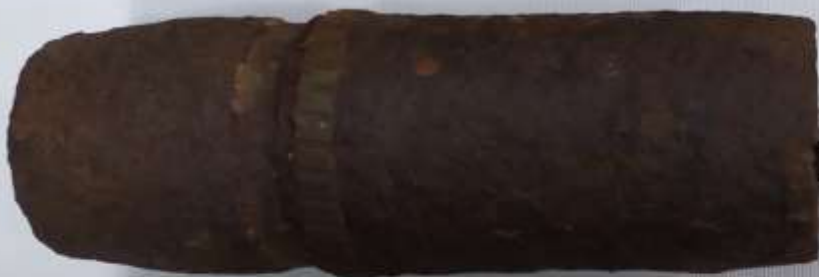
Боеприпас артиллерийский калибр 76.2мм.