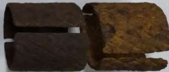
Осколочная рубашка гранаты РГД-33