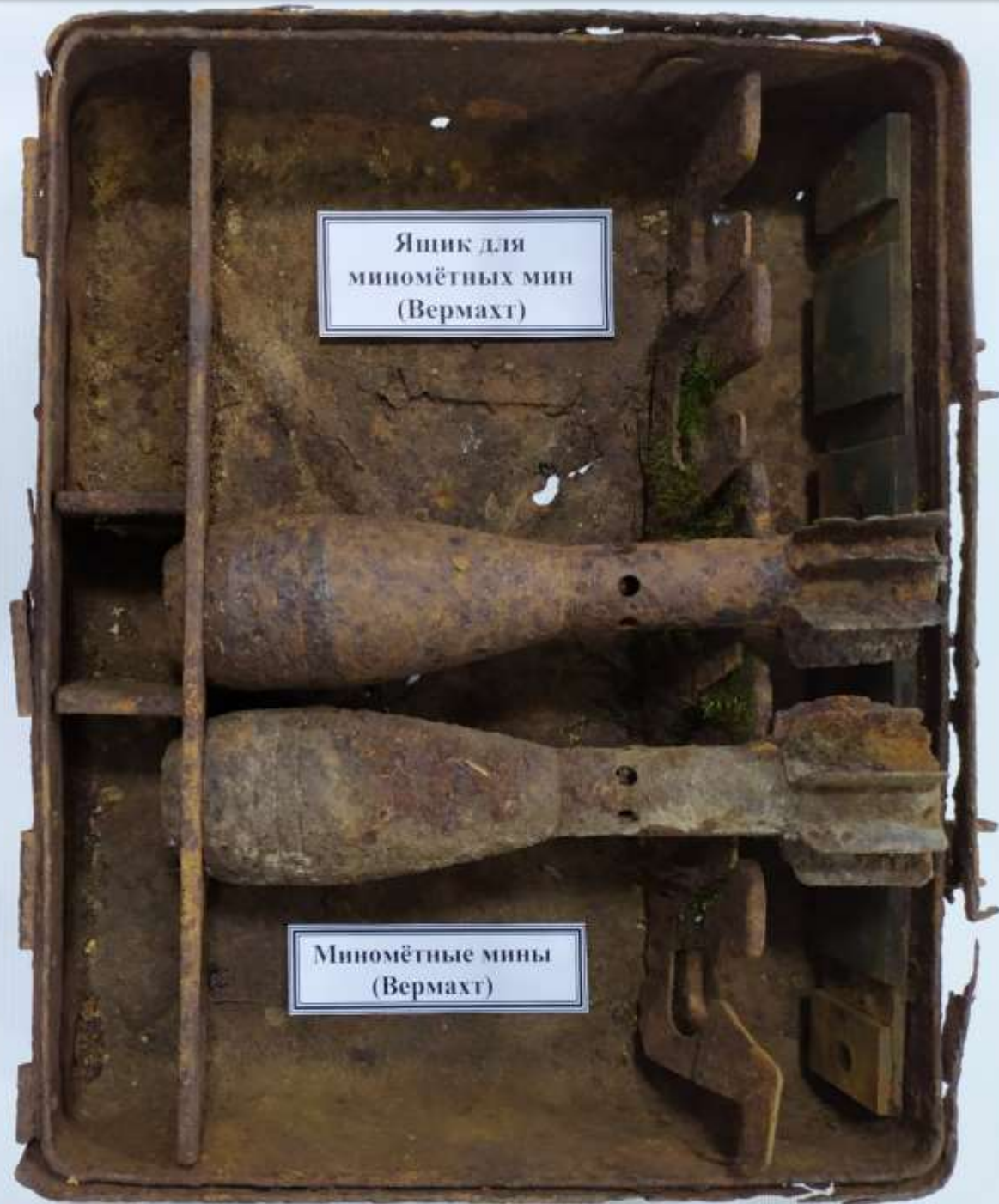
Ящик для миномётных мин (Вермахт)