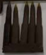
Обойма с патронами винтовки «Мосин»