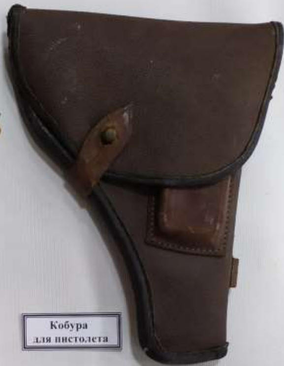
Кобура для пистолета