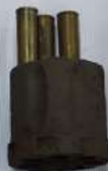
Барaban от револьвера Наган