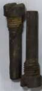
Транспортно-вочная заглушка гранаты Ф-1