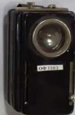
Световой карманный сигнальный фонарь использовался в армии и на ж/д