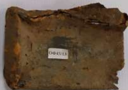
Коробка для мохорки